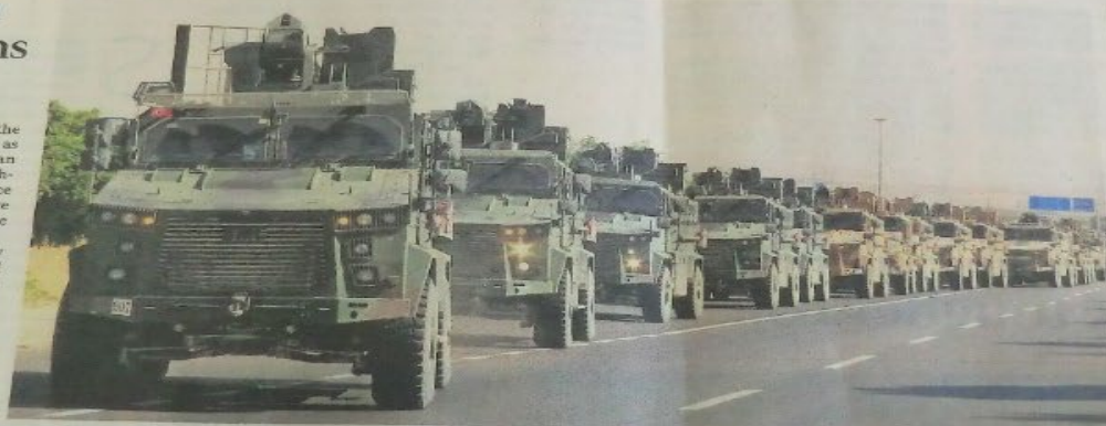
Andrew Aspinall/Reuters/Mark Appleby