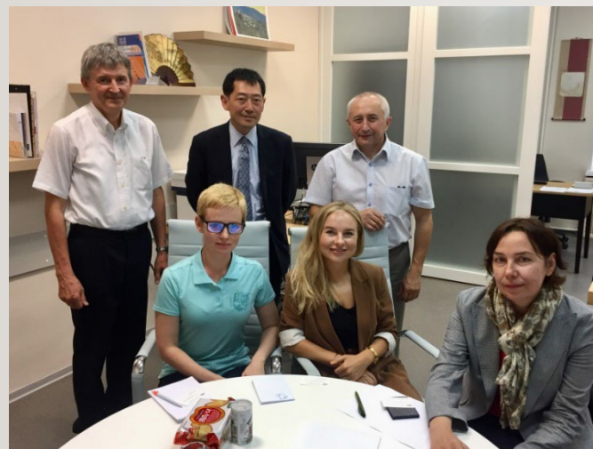
経済学部の先生と打合せ